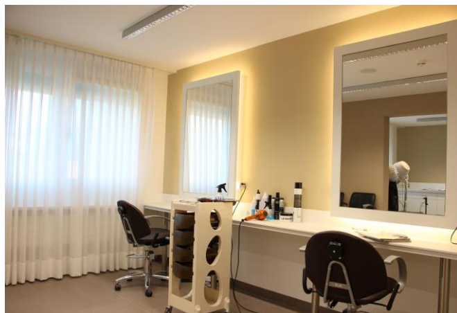
Salon de coiffure